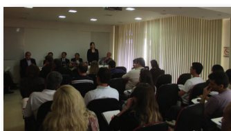
Mercado chinês Pág. 2

Preserve o meio ambiente, não jogue este impresso em via pública.