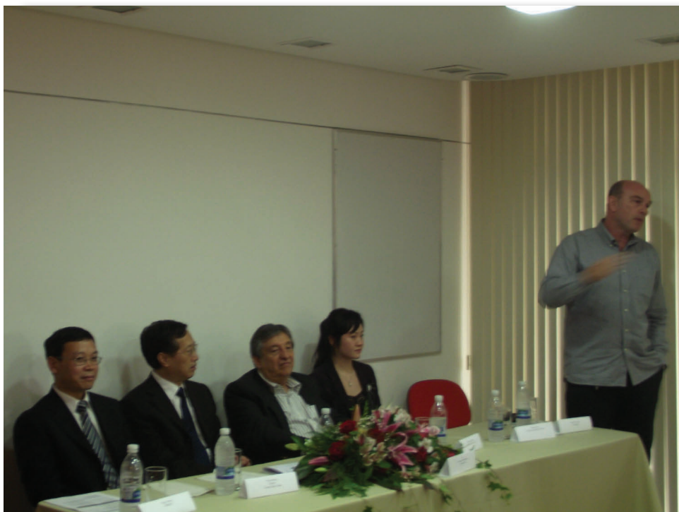
Experiências e oportunidades foram temas de palestras na sede do SICOMÉRCIO.

Com o objetivo de mostrar aos empresários petropolitanos como transformar os chineses em parceiros, ao invés de concorrentes, o SICOMÉRCIO, em parceria com o SEBRAE, apresentou a palestra: “Como Negociar no mercado Chinês”.