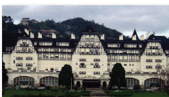
Festival de Inverno Pág. 3