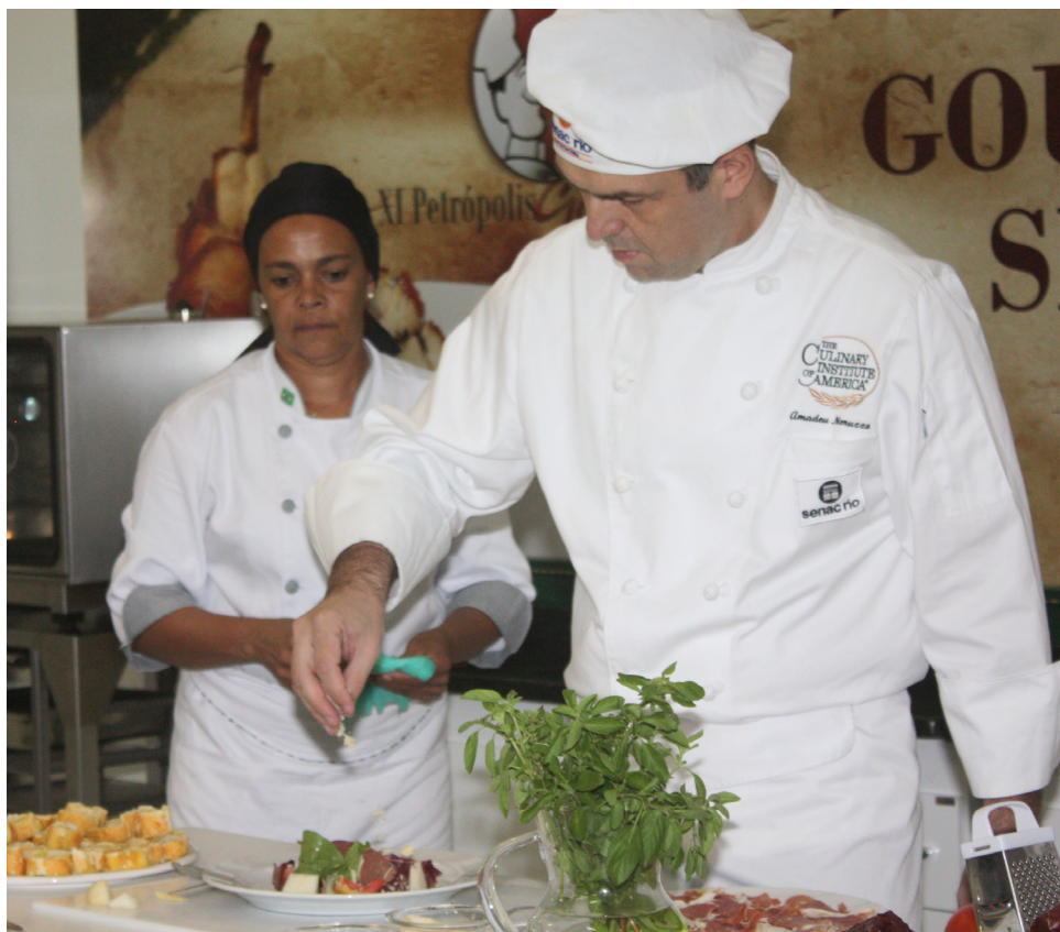
Oficinas e desfiles de moda foram realizados no espaço Gourmet Show.

O festival Petrópolis Gourmet contou com diversas oficinas de gastronomia no Serviço Nacional de Aprendizagem Nacional (SENAC), que montou o espaço Gourmet Show, na sede da entidade, na rua Alfredo Pachá – próximo ao Palácio de Cristal. Foram mostrados como montar pratos típicos italianos, como Risoto di Nero, Fusili all'arrabiata, anchovas em tomate (Bagnun di acciughe) e nhoque de mandioquinha com cogumelos, tomatinhos e ervas.