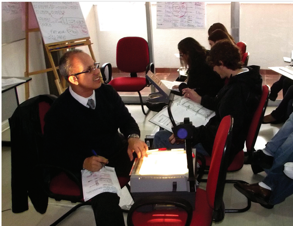
Experiências e oportunidades foram temas de palestras na sede do Sindicato.

O Sicomércio e o Instituto de Desenvolvimento Empresarial (IDEBRASIL) promoveram, em outubro, o Curso de Desenvolvimento Empresarial. As aulas tiveram por objetivo mostrar aos empresários um panorama geral do negócio para trazer resultados imediatos aos empreendedores.