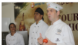
Petrópolis Gourmet Pág. 3