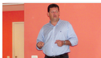
Otimização de vendas Pág. 2

Preserve o meio ambiente, não jogue este impresso em via pública.